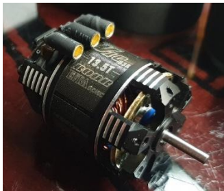
Prese da 3.5 mm